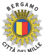
Comune di Bergamo